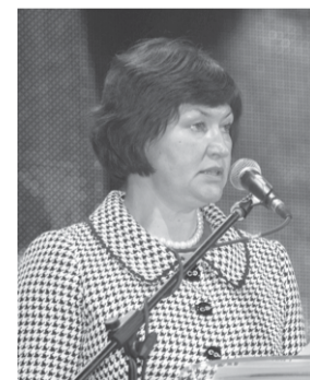
Перший заступник глави Адміністрації Президента України Ірина Акімова привітала присутніх від імені Президента України.

Завершуючи свій виступ він наголосив, що попереду – п'ять років напруженої творчої роботи, яка повинна згуртувати лави ФПУ, привести до розуміння і підтримки наших цілей усім українським суспільством.