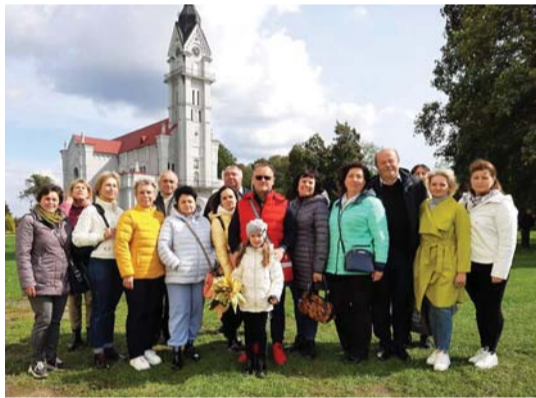
Колектив КНП ЛОР «Львівський регіональний фтизіопульмонологічний клінічний лікувально-діагностичний центр»