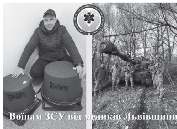
Воїнам ЗСУ від медиків Львівщини

Львівська обласна організація профспілки працівників охорони здоров'я висловлює щирі подяку колективам закладів охорони здоров'я Львівщини, профспілковим організаціям, безпосередньо членам профспілки, які відгукнулися на звернення щодо збору коштів на допомогу Збройним Силам України. Особлива подяка профспілковим організаціям Львівського національного медичного університету ім. Данила Галицького, КНП ЛТМО «Клінічна лікарня планового лікування, реабілітації та паліативної допомоги», Городецький центральний міський лікарні, Інституту патології крові та трансфузійної медицини Національної академії медичних наук України, Львівського обласного клінічного перинатального центру, Львівського обласного центру екстреної медичної допомоги та медицини катастроф, Львівського обласного лікарсько-фізкультурного диспансеру, Пустомитівській лікарні, Львівської медичної академії імені Андрея Крупинського, Славської міської лікарні, Амбулаторії загальної практики сімейної медицини с. Нове місто Самбірського району, 4-ої міської поліклініки м. Львова, 5-ої міської клінічної поліклініки м. Львова та 6-ої міської поліклініки м. Львова, Сколівської центральної лікарні, Кам'янка-Бузької центральної районної лікарні, Червоноградської міської лікарні, 3-ої міської поліклініки м. Львова.