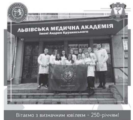
Вітаємо з визначним ювілеєм – 250-річчям!