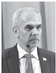
Олег МУСІЙ, народний депутат України, заступник голови Комітету, голова підкомітету з питань забезпечення асоціації з Європейським Союзом Комітету Верховної Ради України з питань охорони здоров'я.

вони не володіють елементарними знаннями процесів, які відбуваються в національній СОЗ. Та схоже, вони усвідомлюють, що не нестимуть ніякої відповідальності за наслідки запропонованих реформ. Тобто проблема не в них, а в особах, які їх оточують, і в тих, ким вони себе оточили. Цим особам байдужі реформи, бо у кращому разі вони – випадкові люди від політичної кон'юнктури. Тому сьогоднішній Форум – це не останній захід, як на це хтось розраховує. Чергові заходи будуть більш радикальними, активними, і влада, врешті-решт, почує медиків, і реформи проводитимуться не в угоду кредиторам, а для народу України.